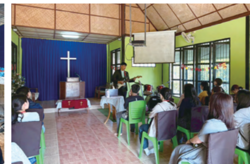
歌って踊って、日曜日の礼拝