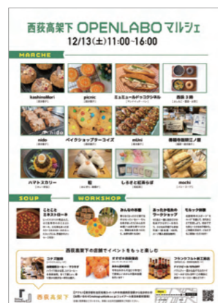
西荻窪高架下 OPEN LABO マルシェチラシ

ジェイアール東日本都市開発による産学連携プログラムとして「西荻高架下 OPEN LABO マルシェ」を開催しました。このマルシェは「多世代交流」や「地域活性化」を目的に、私たち学生が立案し実施したものです。