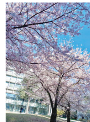
croSS広場に咲く満開の桜