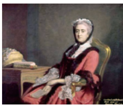
Caroline Fox, 1st Baroness Holland (1723-1774) by Allan Ramsay

近世イギリスの上流階級の間では、ヨーロッパ周遊が流行った。語学を学び、質の高い芸術に触れ、洗練したマナーを身に付けるための青年貴族の旅行で、グランドツアーと呼ばれた。だが、時には成年の女性も旅した。ゼミで手紙を読んでいるオランダ女男爵もそんな女性の一人。