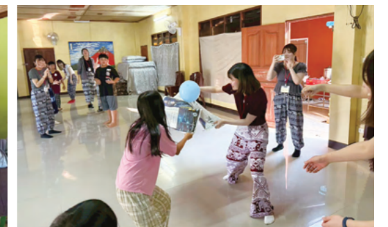
ハラハラ風船運びでレクリエーション