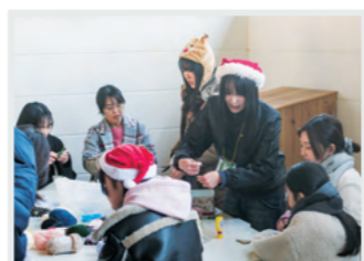
あたたか毛糸 ワークショップの様子

こうして私たちは、「マルシェを開催する」と決め、開催時期の「寒い季節」に着想を得た「あたたかい食べ物、あたたかい人やまち」をコンセプトに、企画書作成や地元の協力者探しを始めました。な