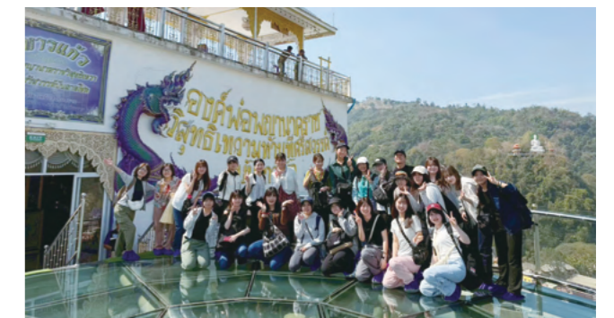
チェンライ視察・パープルテンプルでの集合写真

私がこの活動を通じて得たことは、すてきな仲間との出会いと、人に「与える」ということの大切さです。当初は自分が支援する側だと考えていましたが、実際には子どもたちや現地の人々から多くのものを享受させてもらっていたのだと気付かされました。今回の経験を糧に、私も誰かに「与える」ことを惜みず、他者と支え合う生き方を大切にしていきたいです。