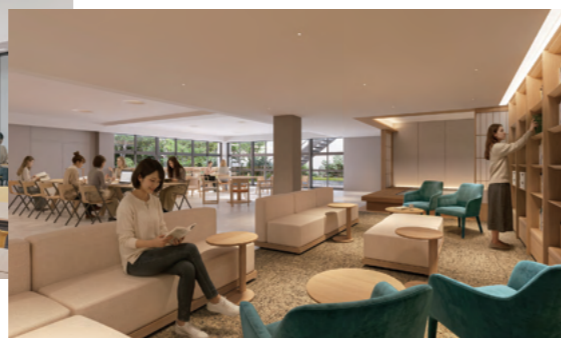
国際学生寮：ライブラリースペース(イメージ図)