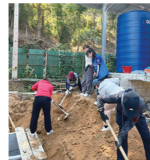
体力勝負のボランティアワーク