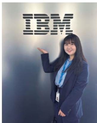
日本IBM虎ノ門オフィス前

大学での学びがすぐに仕事に直結しなくとも、「どのように考えるか」という姿勢は、社会に出てから大きな意味を持ちます。自分の興味にじっくり向き合える東京女子大学の環境を生かし、さまざまな経験に挑戦してください。試行錯誤の中で見つけた自分なりの「軸」は、社会に出た後の大きな支えとなるはずです。