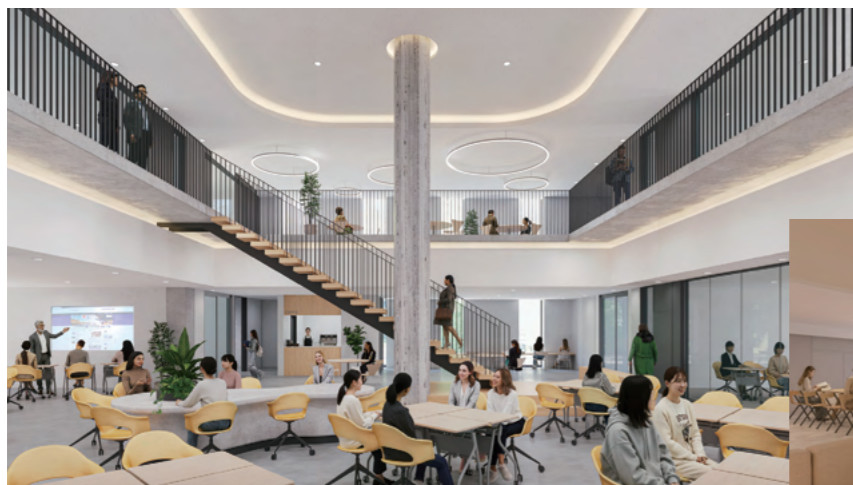
新棟：学生ラウンジ(イメージ図)

れ、多様な学生が共同生活を行い、日常的に英語が飛び交う生活環境を創生します。Live(居住)、Grow(成長)、Meet(交流)をコンセプトとした空間設計を行い、多角的な視点や共感性、そして国際社会で活躍できる英語力とリーダーシップを育むことができるコミュニティを形成します。新たにラウンジやキッチンなどを備えた共用棟を建設し、寮生同士の交流のほか、寮生以外にも開放して、さまざまなイベントが催される文化交流の拠点としてまいります。