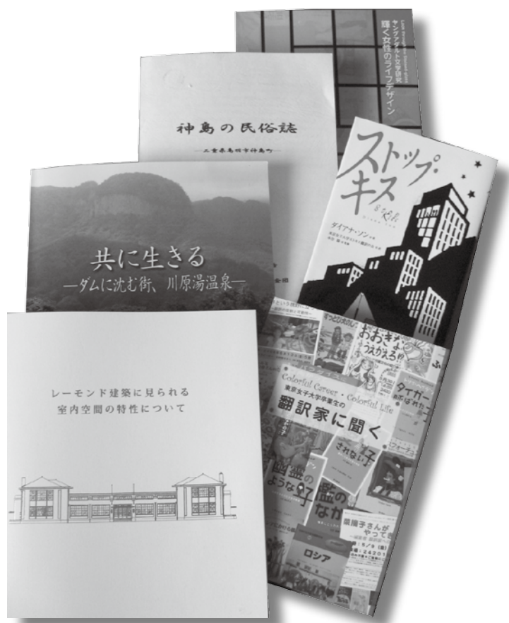
学生研究奨励費 刊行物